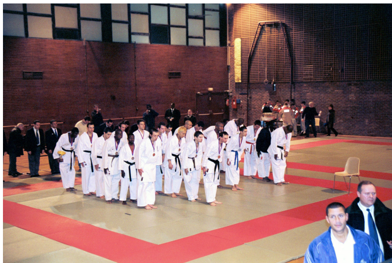
Les équipes participantes